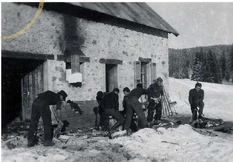
LES MAQUISARDS DU CAMP 3 À GÈVE WWW.VERCORS-RESISTANCE.FR

Après un été à la bergerie de Carteaux et le parachutage d'armes qui n'arrive pas, les maquisards se voient contraints de déménager leur camp au refuge de Gève pour survivre durant l'hiver dans la montagne. Ce récit captivant de l'hiver 43 et du printemps 44 nous emmène dans des missions clandestines à Grenoble et sur le plateau, jusqu'à la bataille du Vercors et la Libération.